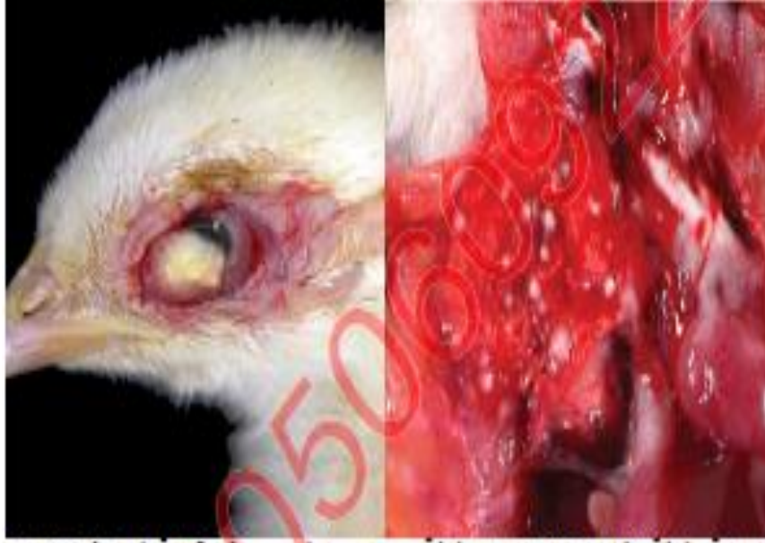
اصابة بالرئة تظهر احترقان شديد بالرئة مع وجود رؤوس بيضاء او نقط بيضاء اسبراجيلوسيس في قرنية العين في كتكوت تسمين عمر اسبوع