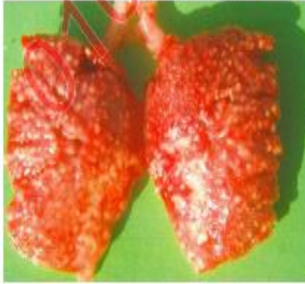
نقط بيضاء او رمادي اللون موجودة على الرئتين بصورة جلية وهذا احد اهم انواع اعراض الاصابة بالاسبراجيلوسيس