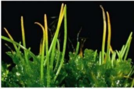
(a) Hornwort الحزازيات القرنية