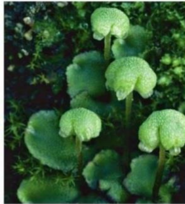
(b) Liverwort الحزازيات الكبدية