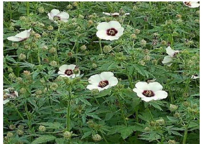
أزهار نبات الججل