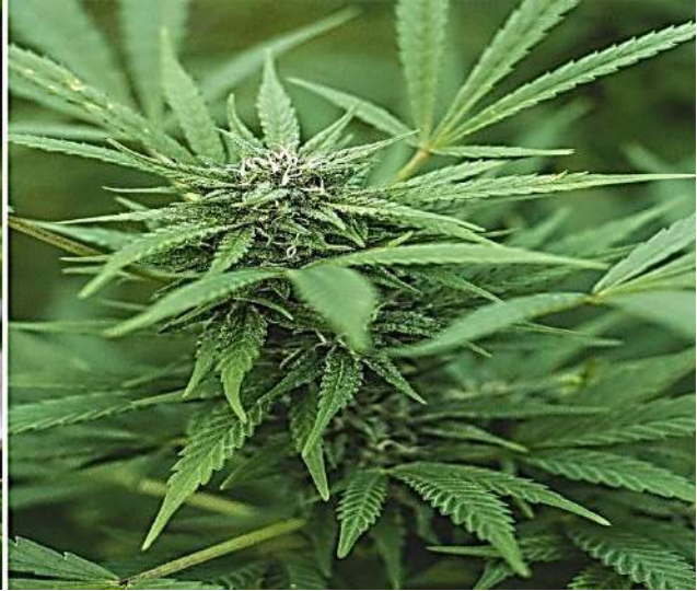
ازهار وثمار نبات الججل