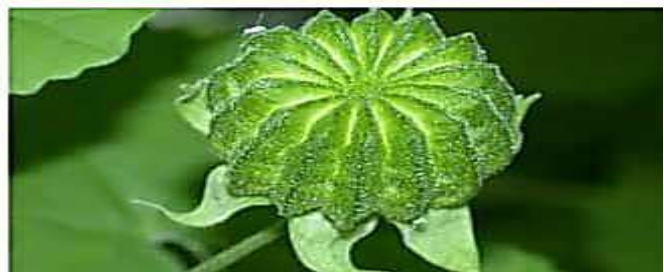
شكل زهرة وثمره والورقة القلبية لنبات الجوت المنشوري