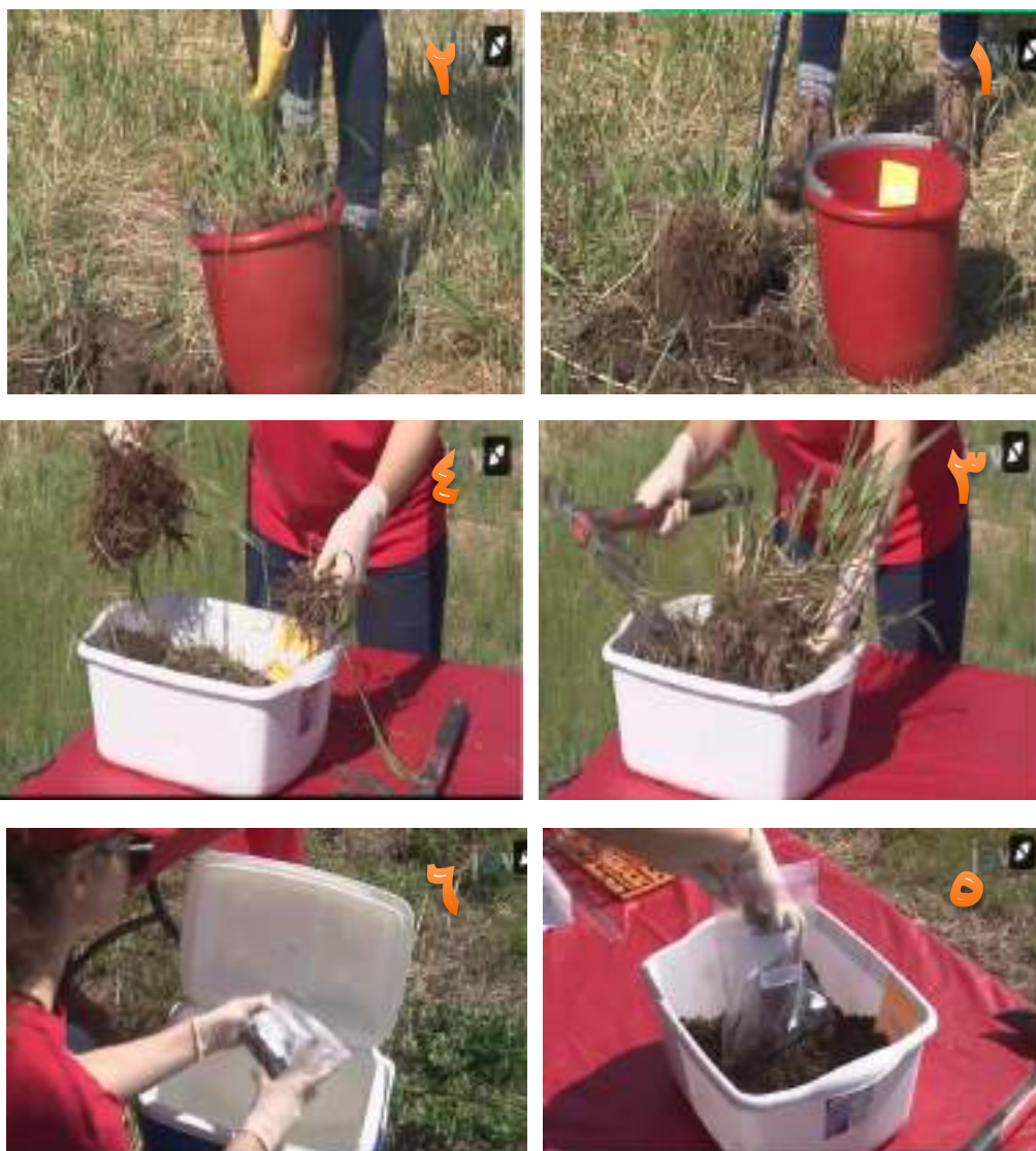
شكل ١-٣ عينات دراسة أحياء التربة وأخذ النماذج من منطقة الجذور