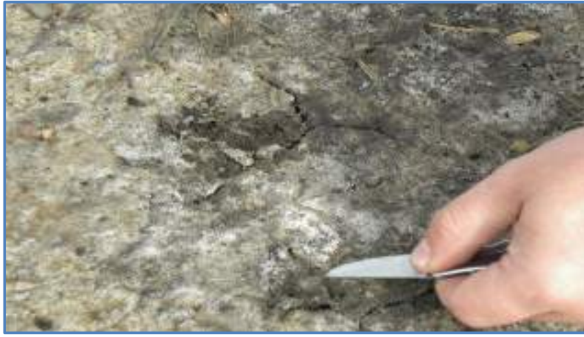
شكل ١-١ القشرة الملحية على سطح التربة Salt and gypsum

وقد اوصى مؤتمر استصلاح الترب الملحية والقلوية والغدقة الذي جرى عقده في بغداد عام ١٩٧٠ بان تراعى النقاط الآتية :