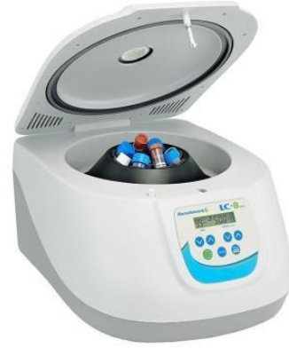
جهاز الطرد المركزي