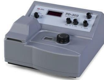
جهاز الطيف الضوئي