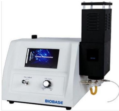
جهاز اللهب الضوئي