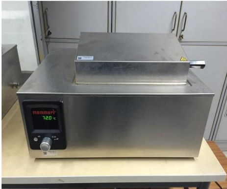
جهاز الحمام المائي