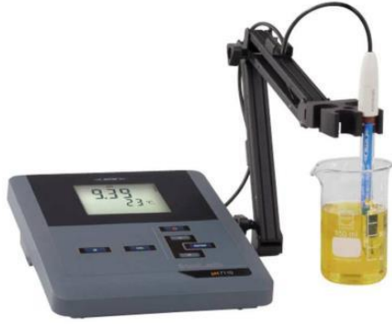
جهاز القياس الهيدروجيني PH