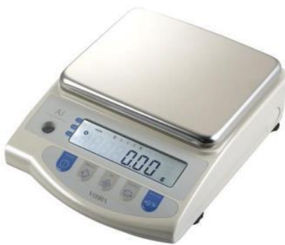
جهاز الميزان الحساس