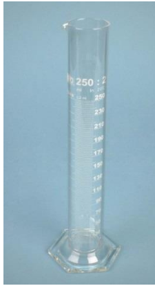
4- اسطوانة مدرجة