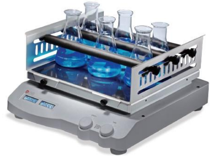
3- جهاز الهزاز الكهربائي