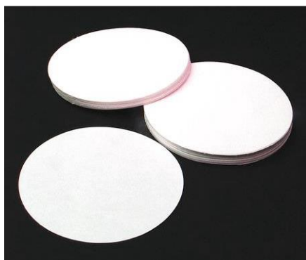
4- ورق ترشيح