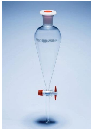
6- قمع فصل