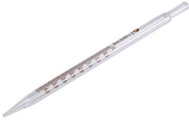
8- ماصة زجاجية