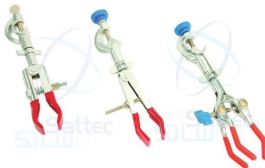
5- ماسك معدني