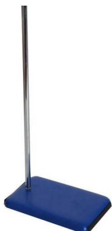
6- حامل معدني