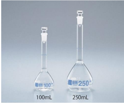
2- دورق حجمي