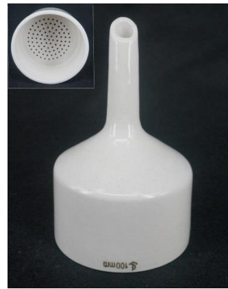
5- قمع بخنر