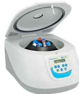
5- جهاز الطرد المركزي