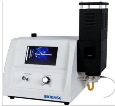
2- جهاز اللهب الضوئي