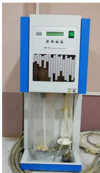
10- جهاز الكدال