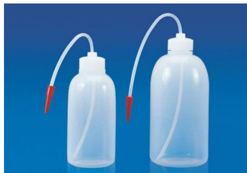
3- علبة غسل