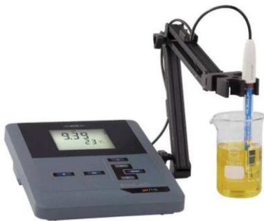
6- جهاز قياس الاس الهيدروجيني pH