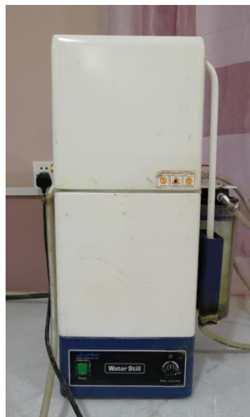
9- جهاز التقطير