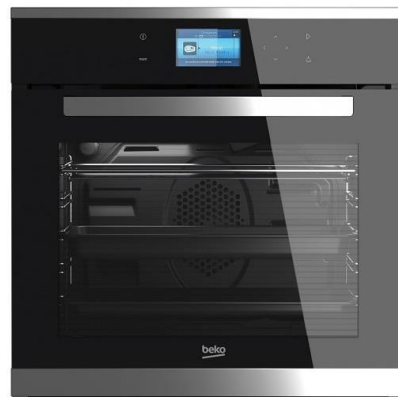
7- فرن الكهربائي