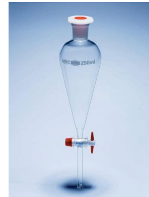
5- قمع فصل