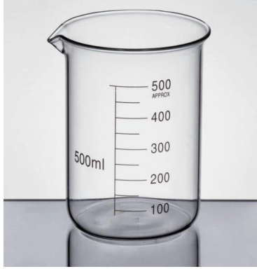
2- قـدح زجاجي (بيكر)