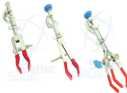
5- ماسك معدني