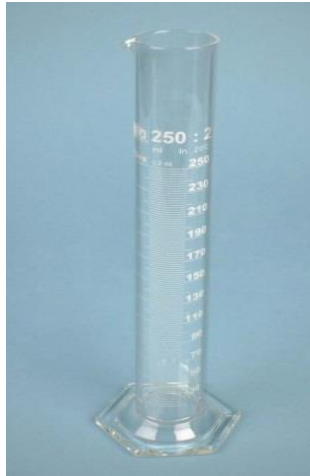
4- اسطوانة مدرجة (سلندر)