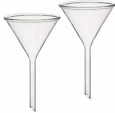
7- قمع ترشيح