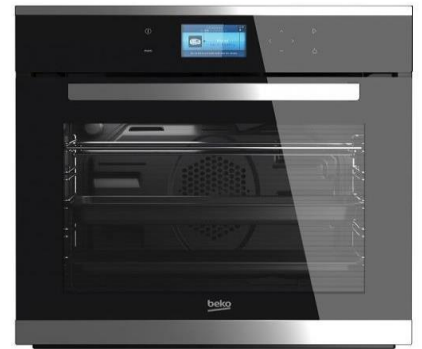
7- فرن كهربائي لتجفيف العينات