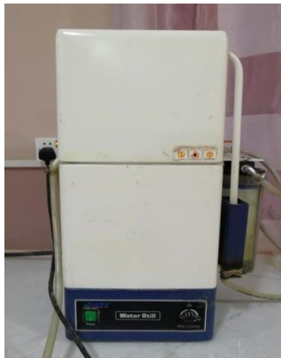
9- جهاز تقطير الماء