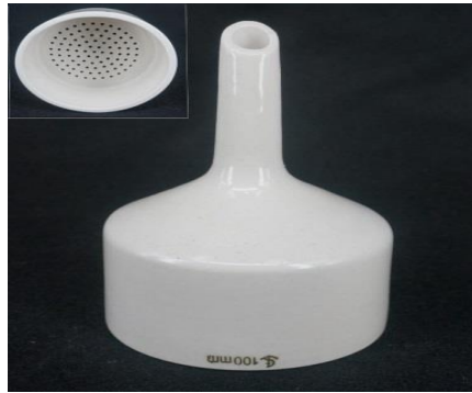
6- قمع بخنر