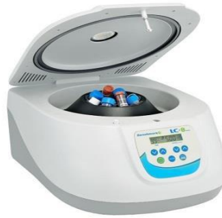
5- جهاز الطرد المركزي