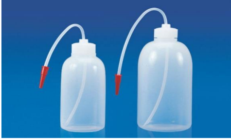
3- بطل غسل