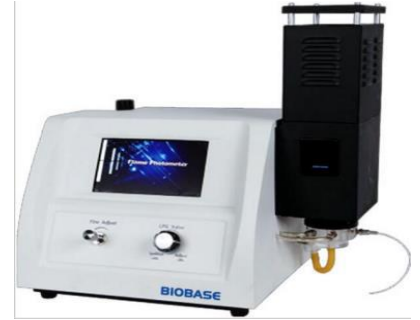
4- جهاز اللهب الضوئي