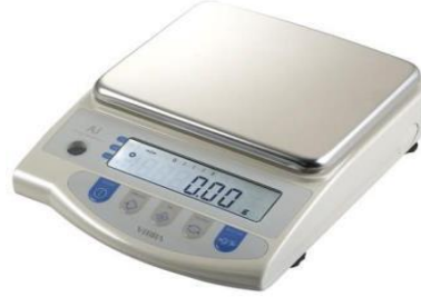
2- ميزان حساس