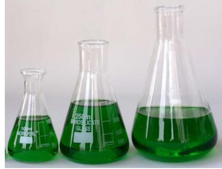
1- دورق مخروطي (قياسي)