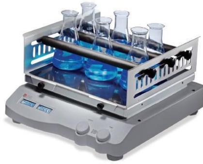
6- جهاز الهزاز الكهربائي