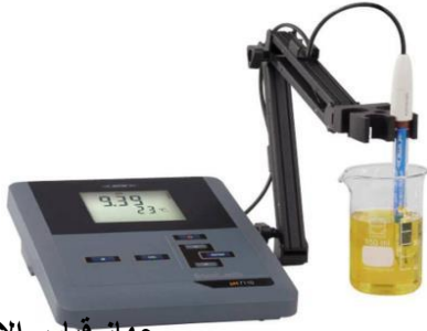
جهاز قياس الاس الهيدروجيني