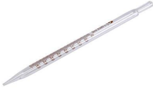
8- ماصة زجاجية