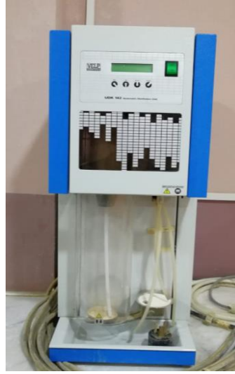
10- جهاز كدال