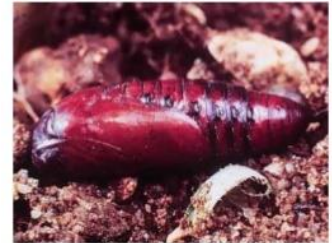
عذراء دودة جوز القطن القرنفلية

from a larva to an adult moth. Most pupation occurs in the top layer of soil beneath cotton plants. The pupa is brown and approximately one-half inch long. It does not feed or move about during the pupal period of seven to eight days.