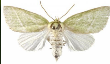
شكل (1) بالغة دودة جوز القطن الشوكية