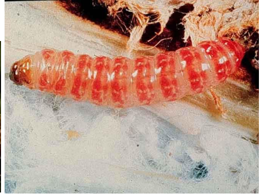
يرقات دودة جوز القطن القرنفلية