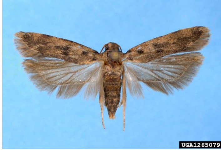
بالغة دودة جوز القطن القرنفلية

العوائل النباتية: القطن – البامية – الكركدية – الختمية