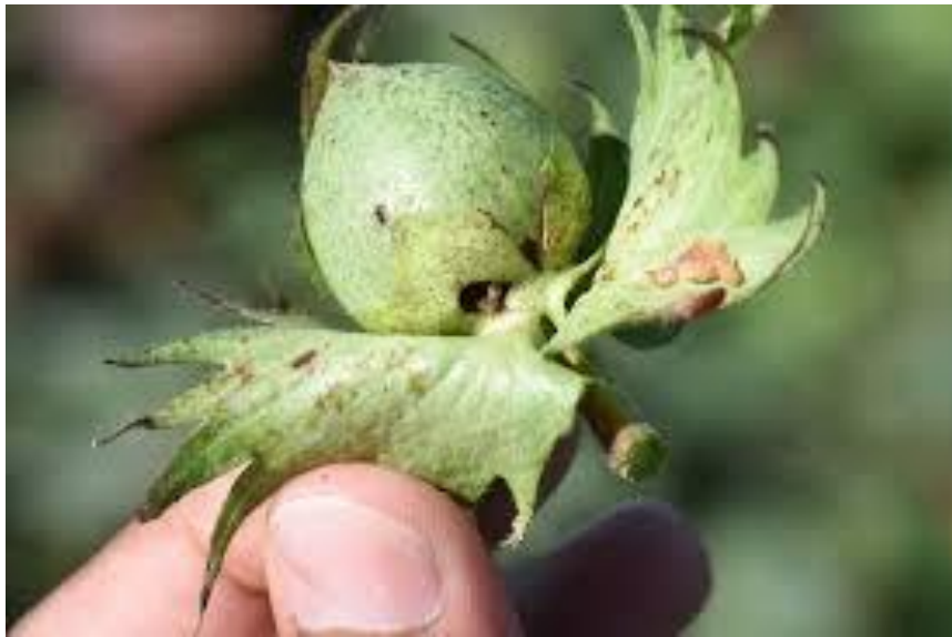
ثقب غير منتظم ليرقة دودة جوز القطن الشوكية من اسفل الجوزة