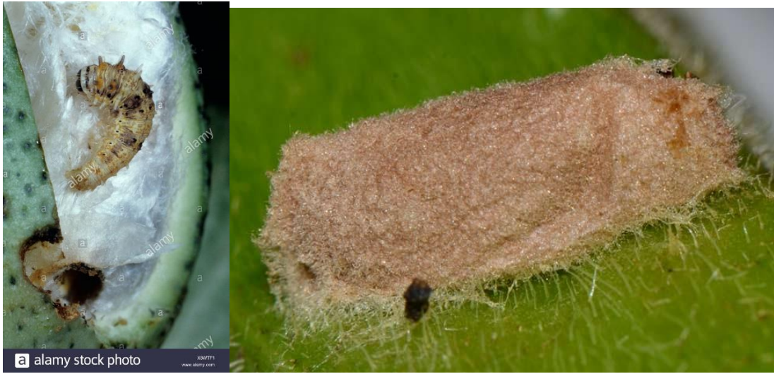
شكل (2) يرقات وعذارى دودة جوز القطن الشوكية

عدد الاجيال: 6 أجيال او اكثر في السنة كما في دودة اللوز القرنفلية ومتزامنة معها تقريباً .