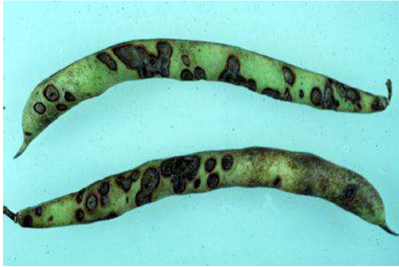
ر - ضربة الشمس Sun Scald :