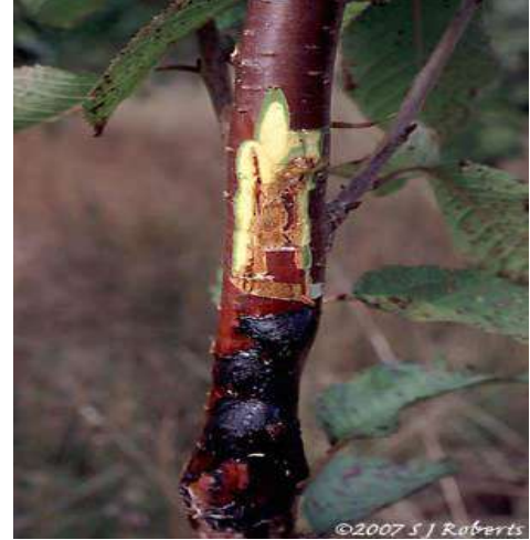
د - موت الأطراف (الموت الرجعي) : Die Back