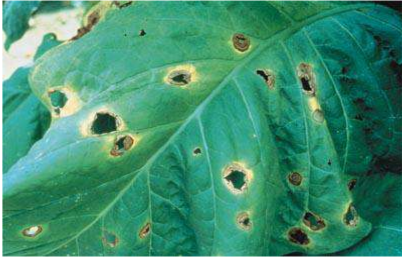
ت - التلطح Blotch :