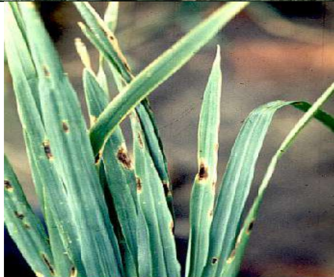
Net blotch ( Pyrenophora teres ) of barley.