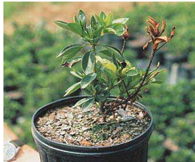
ذ- الانثراكنوز Anthracnose :