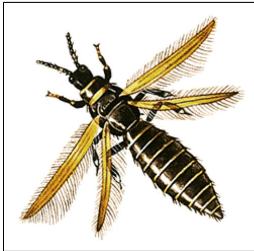
شكل حشرة الثريس