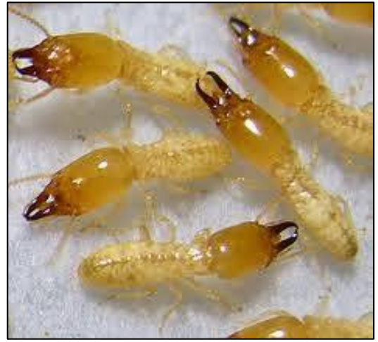
شكل جنود حشرة الارضة