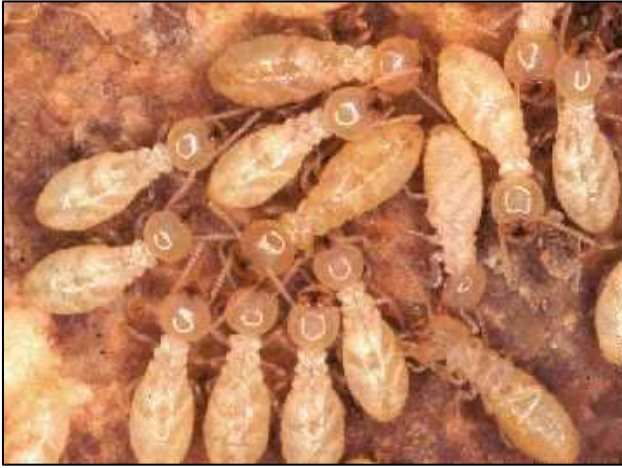
شكل شغالات حشرة الارضة